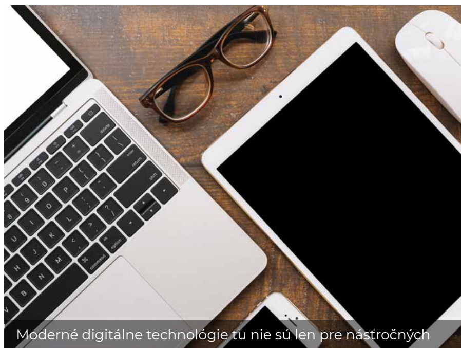
Moderné digitálne technológie tu nie sú len pre nástrojných