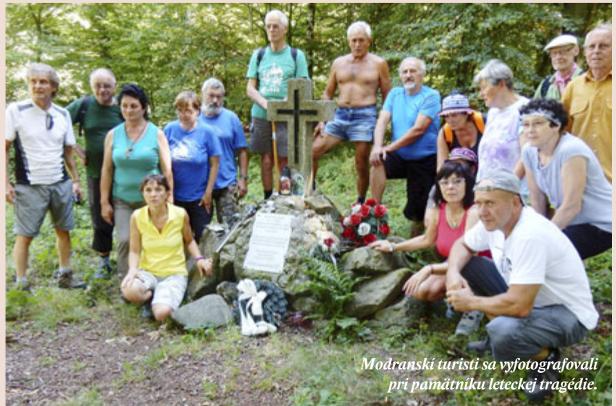
Modranskí turisti sa vyfotografovali pri pamätníku leteckej tragédie.

V minulom roku uskutočnil MTS pochod zo Svätého Jura na Biely Kríž a späť. Dĺžka pochodu bola 15 km, prechádzala nenáročným terénom. Za Neštichom nad Svätým Jurom si prezreli zrúcaninu hradu Biely Kameň. Historické pamiatky v Malých Karpatoch sú najčastejšie cieľom modranských turistov. Počas pochodu stretali ďalšie skupiny