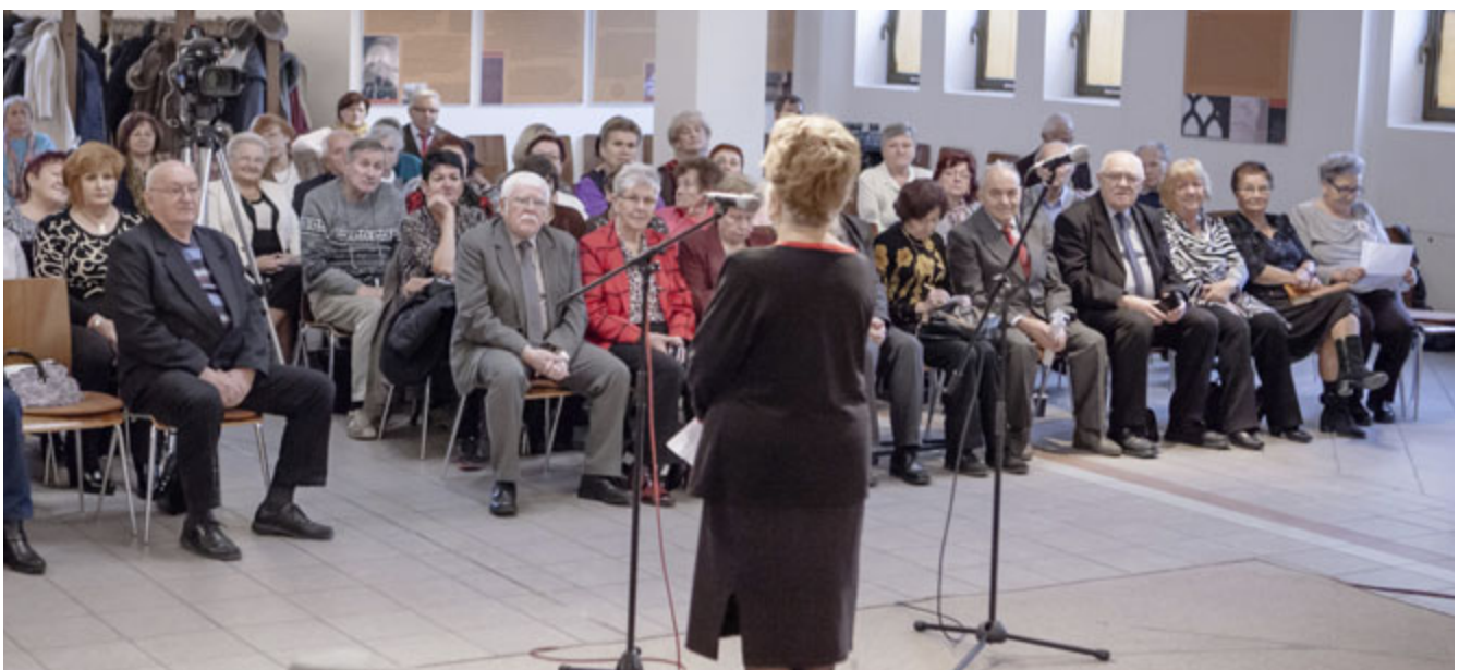
Spomienka na Poetickú Nitru 2016